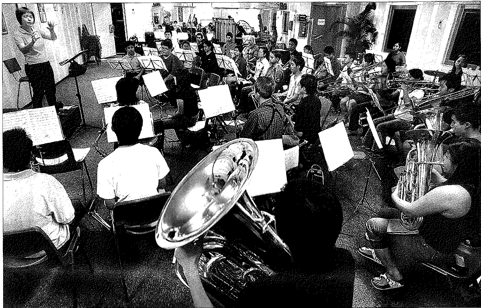
裕青民众俱乐部的艺韵室内乐团，不但在国际音乐比赛中获奖，也拥有丰富的大舞台演出经验。